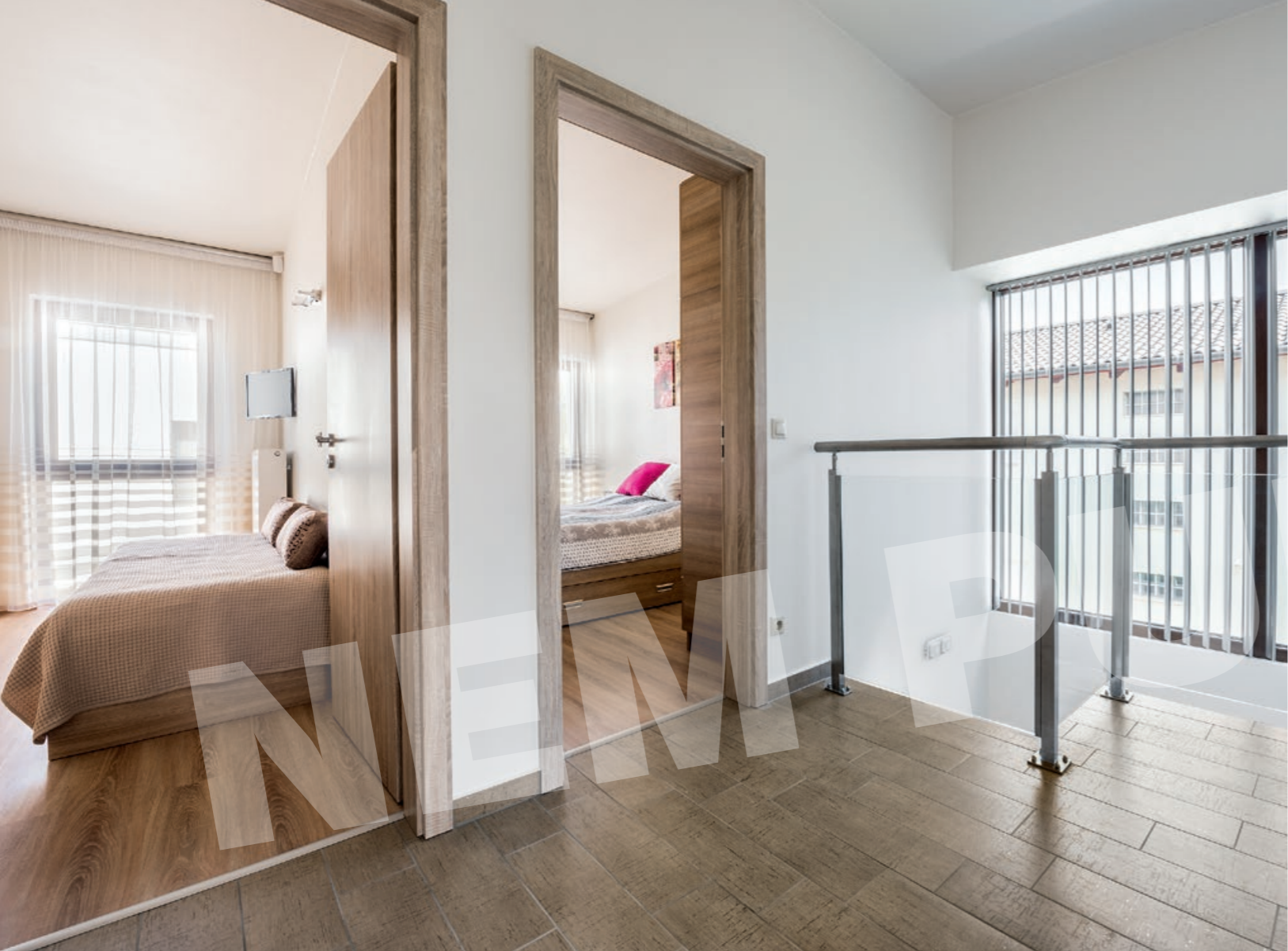
A fahatású padlóburkolatokkal harmonizáló beltéri ajtók a kőlapokkal együtt elegáns alapul szolgálnak a pihenőzóna berendezéséhez.