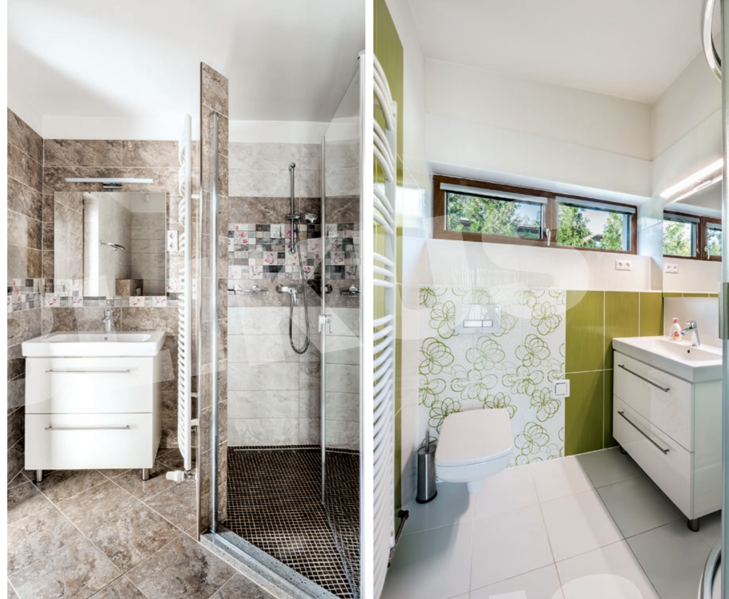
Mindkét vízeshelyiség hasonló felszereltségű, csak a burkolatválasztással játszottak egy kicsit.

Az épületszerkezetek hagyományosak. A vakolt homlokzatokból kiemelkedik a lépcsőházak műgyanta kötésű, szerelt táblás burkolata. A nyílászárók faszerkezetűek. A kis hajlásszögű vasbeton tetőfödémeket korcolt alumíniumlemez fedi.