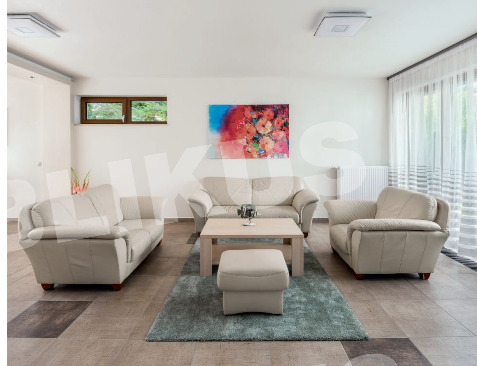
Ideális a konyha és az étkező kapcsolata a közös udvarral, ahol a családok összejöhetnek, míg a saját kertre nyíló nappali intimebb helyzetű.